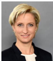
DR. NICOLE HOFFMEISTER-KRAUT MDL (MEMBER OF THE STATE PARLIAMENT) MINISTERIN FÜR WIRTSCHAFT, ARBEIT UND WOHNUNGSBAU DES LANDES BADEN-WÜRTEMBERG MINISTER OF ECONOMIC AFFAIRS, LABOUR AND HOUSING OF THE STATE OF BADEN-WÜRTEMBERG